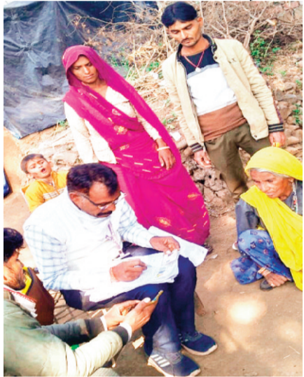
एसआईआर कार्य की प्रगति की समीक्षा कर रहे हैं। सभी बीएलओ, पंचायत सचिव, रोजगार सहायक, आंगनवाड़ी, निकायों व पंचायत का अधीनस्थ अमला दिन के साथ-साथ रात में भी इस काम को पूर्ण करने में जुटा हुआ है।

जिले में मतदाता सूचियों का गहन पुनरीक्षण कार्य (एसआईआर) तीव्र गति से चल रहा है। जिले की सभी पांचों विधानसभाओं में एसआईआर प्रगति की बात करें तो अब तक लगभग 79 फीसदी कार्य पूर्ण हो चुका है। दूसरे शब्दों में सभी बीएलओ द्वारा मतदाताओं से प्राप्त गणना पत्रकों का 79 प्रतिशत डिजिटाइजेशन पूरा किया जा चुका है। आपको बता दें कि जिले में कुल 11 लाख 78 हजार 113 मतदाताओं के गणना पत्रकों का डिजिटाइजेशन होना है, जिनमें से 25 नवंबर की शाम 6 बजे तक 9 लाख 25 हजार के लगभग मतदाताओं के फार्म डिजिटाइज्ड किए जा चुके थे। अगर विधानसभावार देखें तो अभी तक हर एसआईआर कार्य में खिलचीपुर विधानसभा अखिल एसआईआर है।