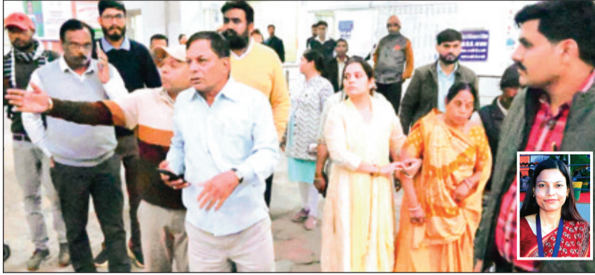
विदिशा। घटना के बाद अस्पताल पहुंचे नायब तहसीलदार के माता-पिता का रो-रोकर बुरा हाल था।

सोमवार सुबह एक दर्दनाक हादसे में एक नायब तहसीलदार की अपने फ्लैट की तीसरी मंजिल से गिरने के कारण मौत हो गई। पुलिस जांच में जुट गई है।